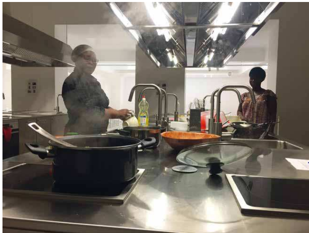
DES FEMMES ACCUEILLIES AU PALAIS DE LA FEMME EN PLEINE PRÉPARATION DU REPAS DU SOIR.